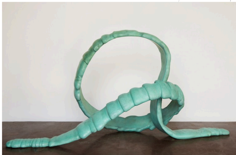
Nicolas Deshayes, "Dear Polyp"